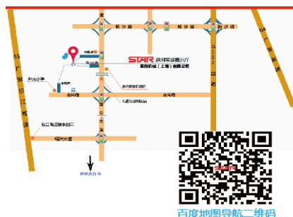
(地铁11号线沙井站与马鞍山站之间拾悦城往福永方向900米左右)